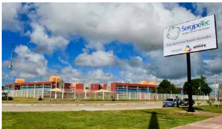
Parque Tecnológico de Sergipe - Sergipetec

Apesar de saber que não se pode replicar literalmente modelos de um lugar para