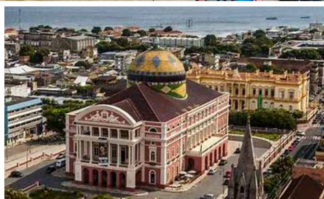
Belém - Pará

Os locais de destino são desmembrados, ou seja, pode optar apenas por Belém, com ida e retorno para Aracaju ou optar pelos outros programas. A diretoria da Sobrames está estudando a possibilidade de realizar um sarau na paradisíaca cidade mexicana, por volta do dia 10 de outubro.