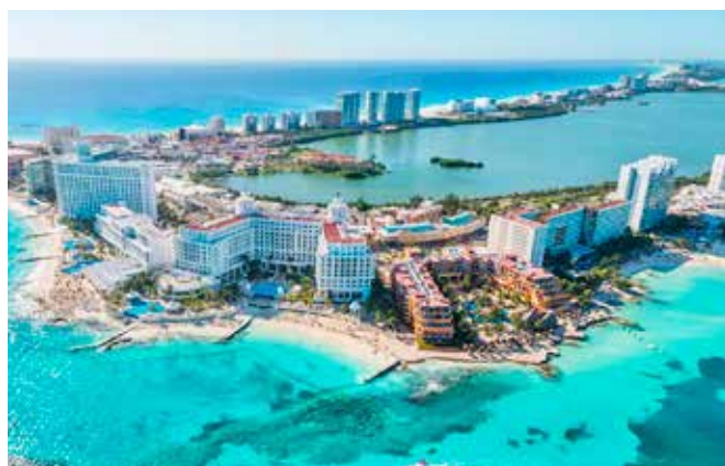
Cancun - México

O que acham da ideia? Depois do inesquecível Sarau Espelho d'Água, em Lisboa, ocorrido em 2018, um novo sarau internacional da Sobrames estaria de bom tamanho!