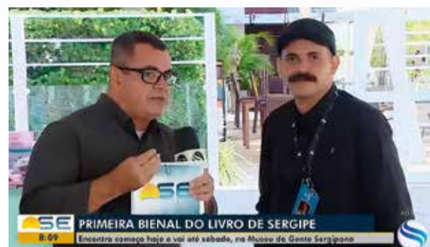
SETV, TV Sergipe.

conseguiu ir aproveitou do conforto de sua casa. Não fomos apenas um “intervalo” comercial; fomos o conteúdo principal. Ver a nossa Bienal na TV, com a mesma dignidade dos grandes centros, validou o esforço de cada voz dessa construção coletiva. A mídia entendeu que a Bienal é um patrimônio do estado e, ao abrir esse espaço, ajudou a democratizar o acesso ao livro para milhares de pessoas e a aumentar sua audiência.