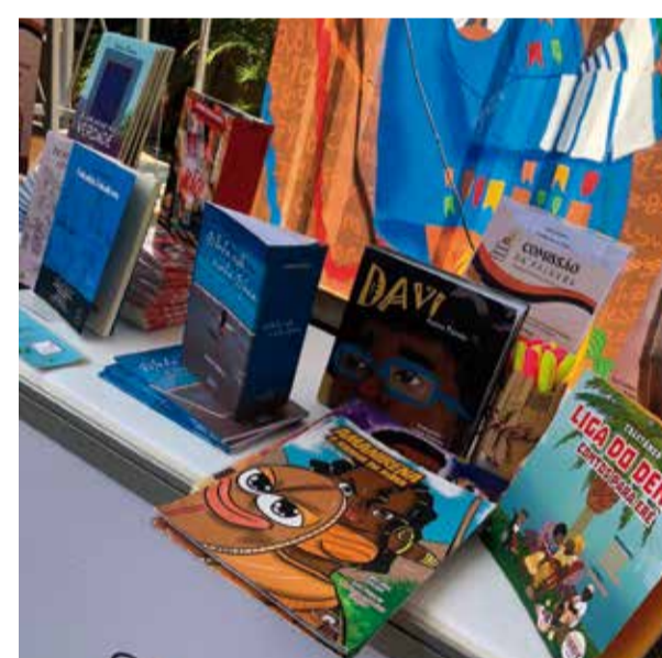
Comissão da Palavra, patrocinadora Bronze.

Você tem um manuscrito guardado esperando o momento certo? Aproveite este evento para procurar uma dessas editoras de sua preferência e faça seu orçamento. A 2ª Bienal do Livro de Sergipe 2027 está logo ali, e este é o lugar e o palco onde sua história pode, finalmente, ganhar vida e ser lançada ao mundo.