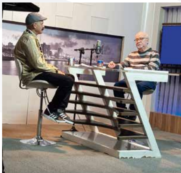
Programa Expressão, TV Aperipê.

Durante os três dias, 18, 19 e 20 de setembro, a literatura sergipana foi pauta constante no rádio e nas telas da