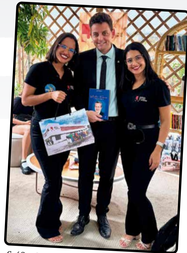
Gráfica J Andrade, patrocinadora Master.