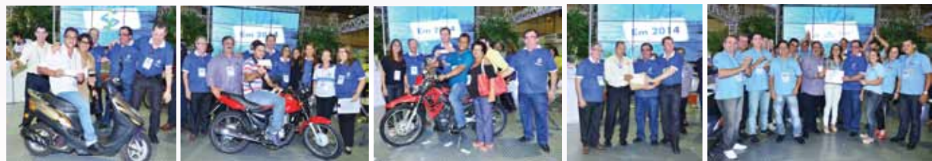
Ganhador do sorteio da moto no dia 26 de abril