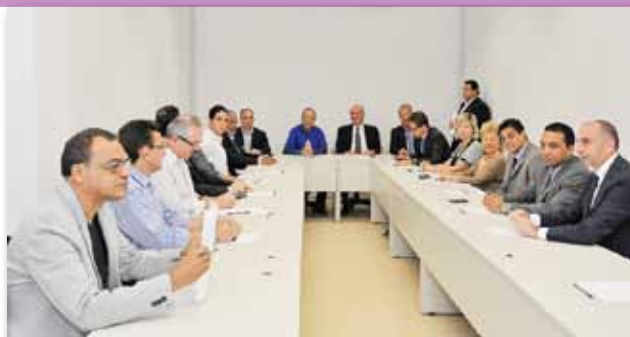
Reunião entre Governo do Estado e AlmagivA

Para o vice-governador Jackson Barreto, que também acompanhou a visita às instalações, a chegada da AlmagivA representa uma exemplar vitória da política de captação de investimentos do governador Marcelo Déda que já promoveu a geração de 99.434 empregos formais de 2007 a 2012 na economia sergipana-