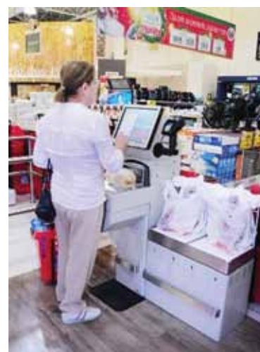
Caixa de autoatendimento no Super Muffato

Em 2003, o Pão de Açúcar implantou o primeiro sistema de self checkout brasileiro, numa unidade de São Paulo. O projeto se transformou no Personal Shop, atualmente em funcionamento em quatro lojas da cidade, que permite também escolher produtos e pode até entregá-los em casa, após a compra.