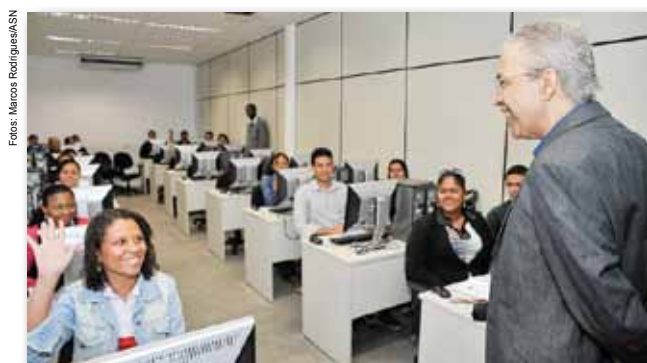
Governador com funcionários da unidade sergipana da AlmavivA

Contextualizando a passagem do “Dia do Trabalhador”, 1º de maio, o governador afirmou que a melhor maneira de comemorar a data é ver os postos de trabalho sendo ocupados pela juventude sergipana. “Nossa alegria é ver carteiras de trabalho sendo assinadas e jovens conquistando seu primeiro emprego”, salientou.