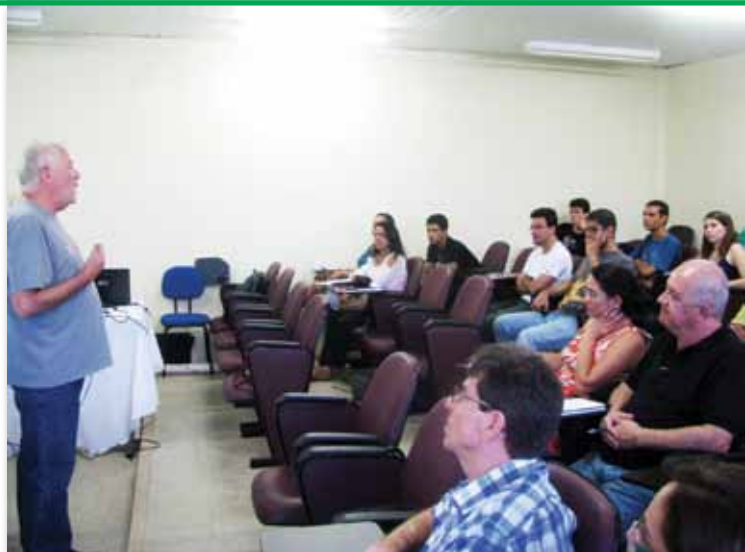
Palestra foi direcionada aos estudantes de Pós-Graduação em Educação da UFS