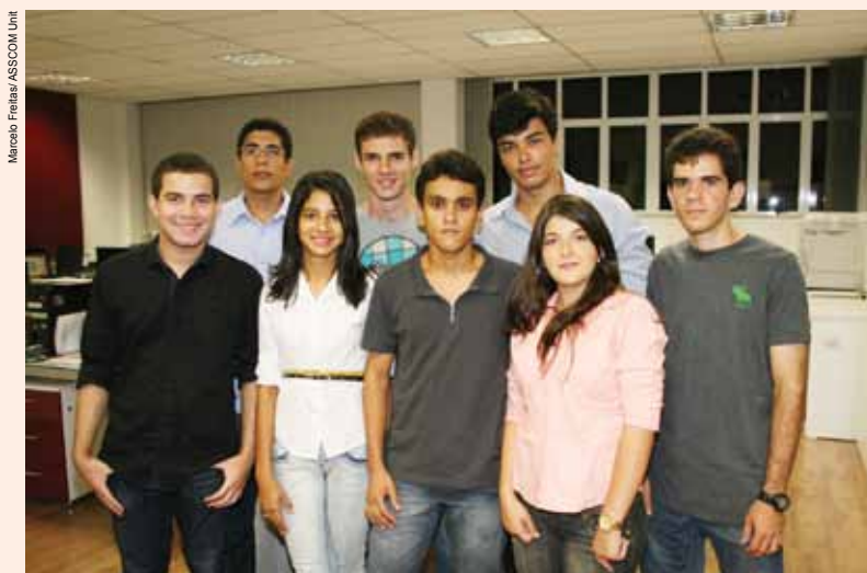
Estudantes de Engenharia criam projeto para melhorar trânsito em Aracaju

O prefeito João Alves Filho se comprometeu em apresentar o projeto dos alunos da Unit aos gestores da Empresa Municipal de Obras e Urbanização – Emurb