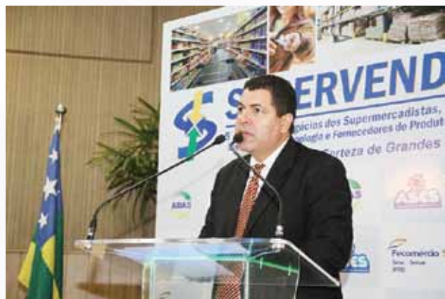
Saumíneo Nascimento, secretário de Estado do Desenvolvimento Econômico e da Ciência e Tecnologia (Sedetec)

“A Sedetec tem tido um bom relacionamento com os empresários do ramo. Algumas ações estão sendo desenvolvidas e aqui podemos destacar o trabalho da Codise, que agora é uma Companhia de Desenvolvimento Econômico do Estado de Sergipe. Também vale lembrar a melhoria na logística do transporte rodoviário, no nosso Porto e estamos estudando