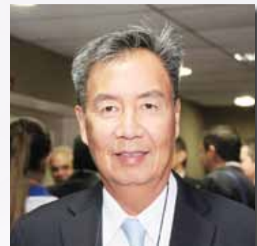
Fernando Yamada, presidente da Associação Brasileira de Supermercados (Abras)

O presidente da Associação Brasileira de Supermercados (Abras), Fernando Yamada, convidado de honra, parabenizou a realização do Supervendas. “Os estados que promovem esses eventos contribuem muito para o trade turístico, porque há uma mobilização dos supermercados junto com os outros atacadistas e o comércio. Se o governo atentar isso como prioritário, ele vai ver que é um dos maiores eventos da capital e isso vai fazer fomentar o setor. A gente percebe que o governo já enxerga isso, mas ele tem que ver como estratégico, porque vai agregar, somar e dar identidade para o estado. É isso que irá fomentar o turismo de negócios”.