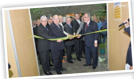
Corte da fita de abertura