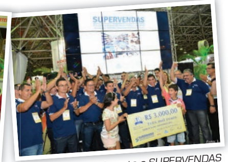
Sorteio de moto durante o SUPERVENDAS