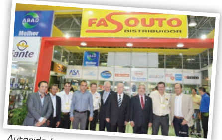
Autoridades em visita aos estandes