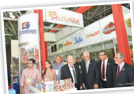
Autoridades em visita aos estandes