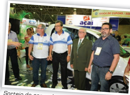
Sorteio de carro durante o SUPERVENDAS