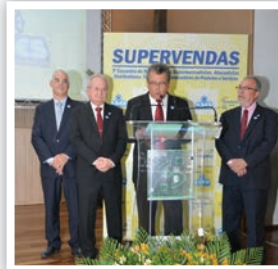
Discurso dos Presidentes - ASES, FECOMÉRCIO e SINCADISE